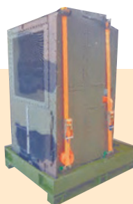
Unité de refroidissement eau sur son support