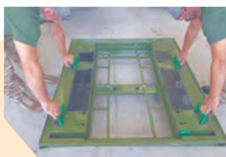
Support de stockage et de manutention