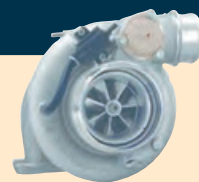
Réparation et refabrication de turbos