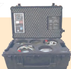
Valise de transport de matériel électronique