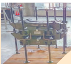
Rénovation de vis de supports de munitions